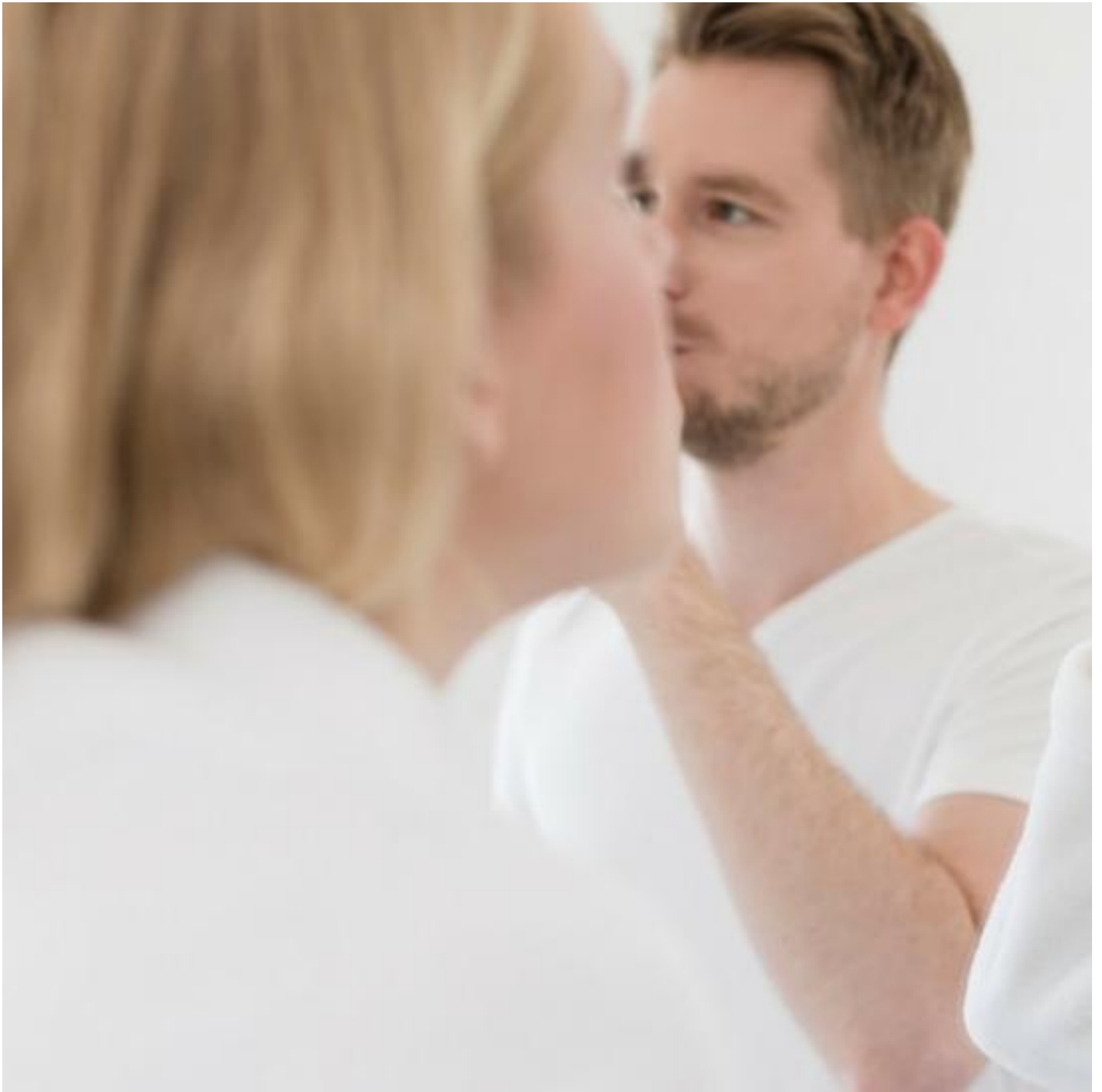
Spiegel von Saint-Gobain