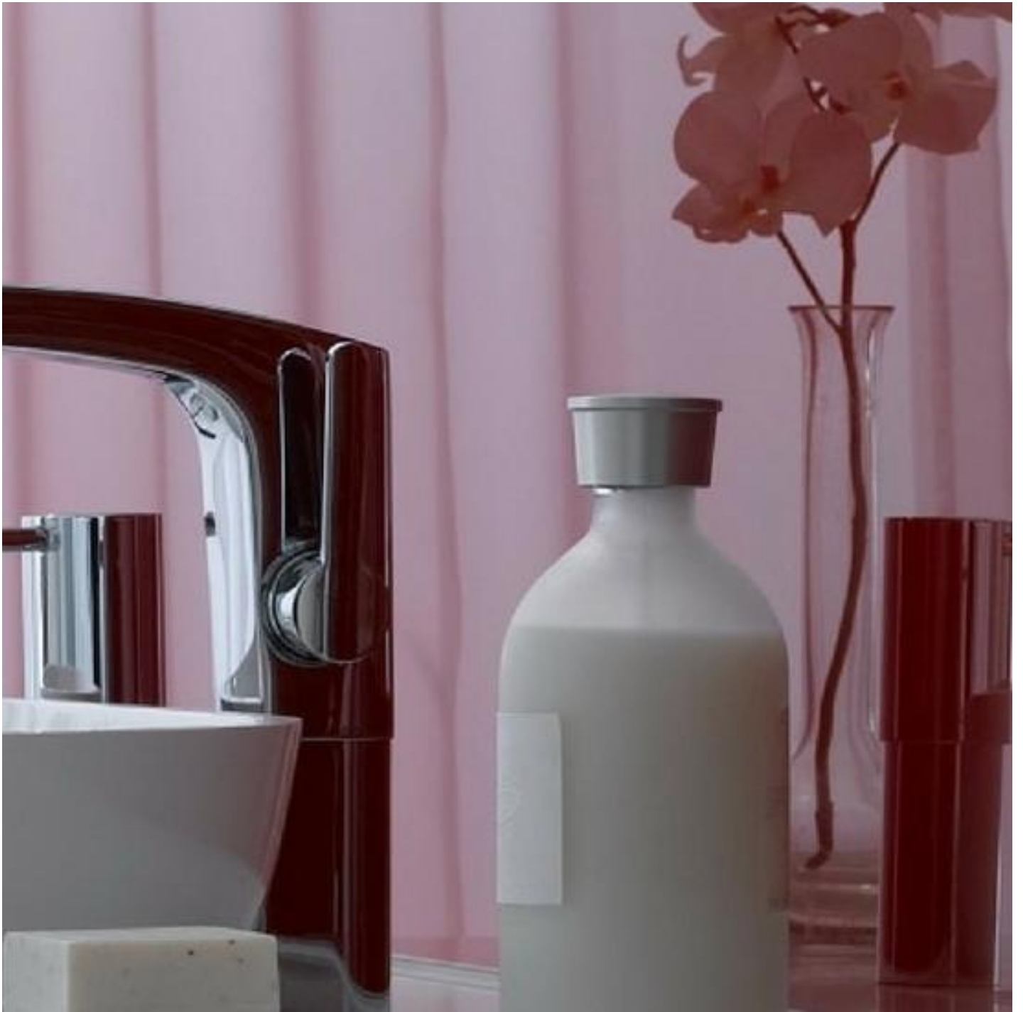
Farbiges und Lackiertes Glas für eine tolle Innendekoration