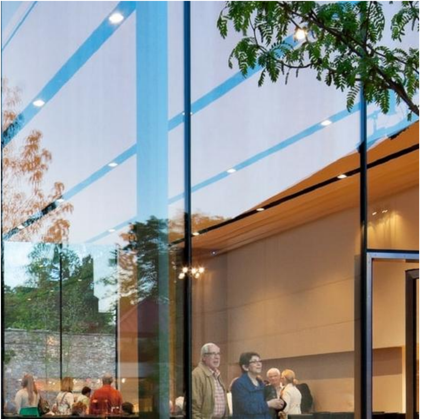
XXL - GLAS IN ÜBERLÄNGEN