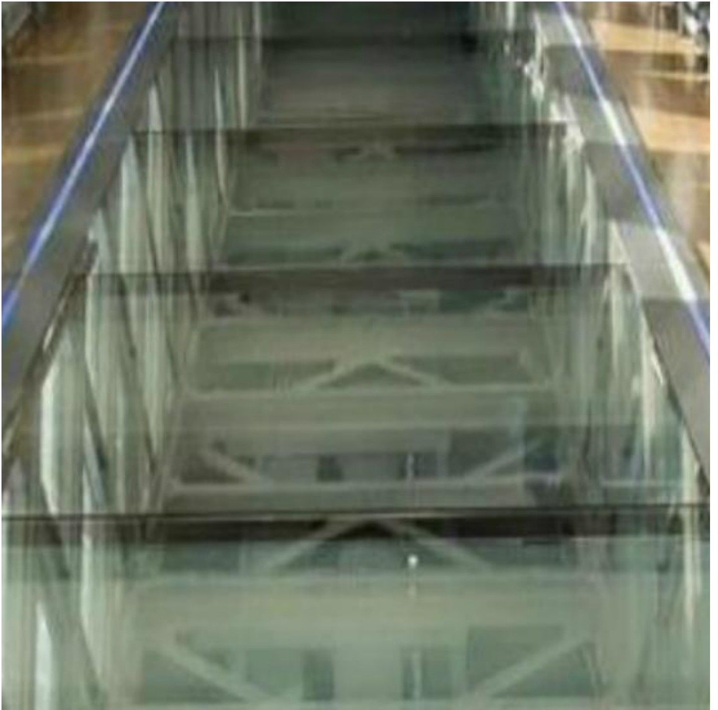
SGG CLIMAPLUS® SAFE / SGG CLIMAPLUS® PROTECT