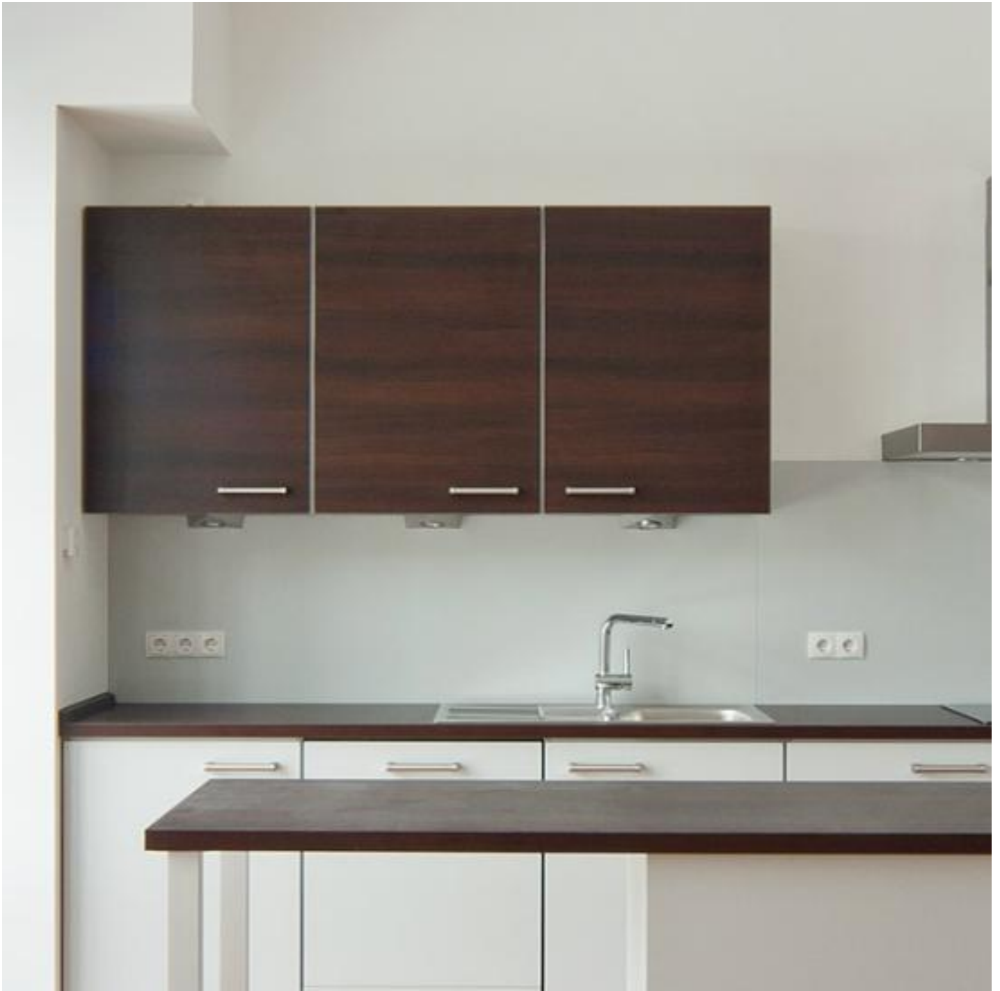
ISOLIERGLAS MIT SPROSSEN