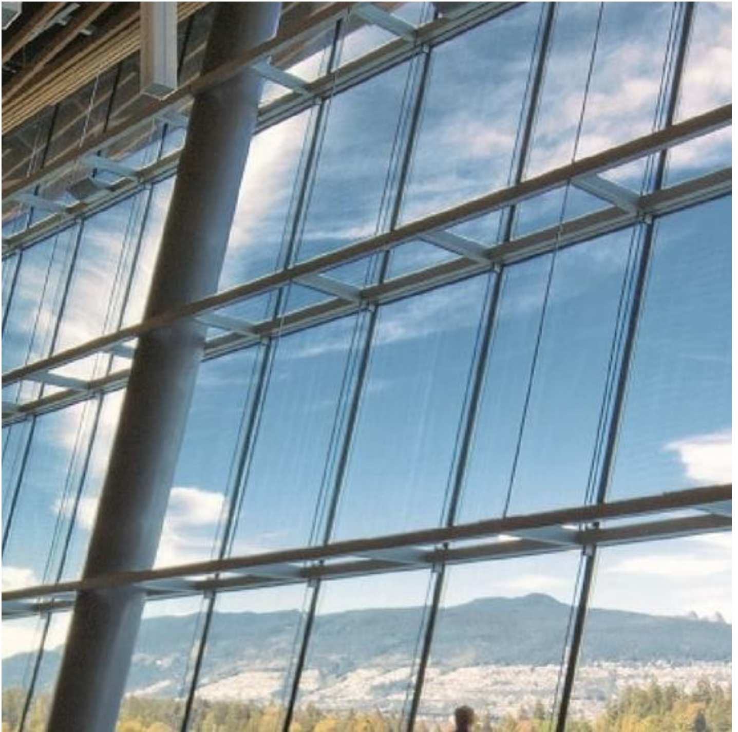
Fassadensysteme -starke und ästhetische Fassaden