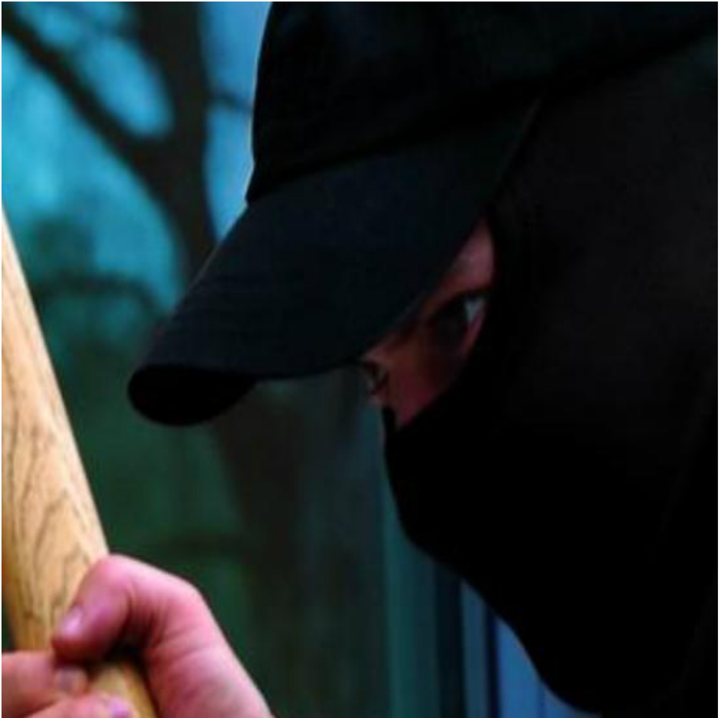
CLIMAPLUS / CLIMATOP XN PROTECT