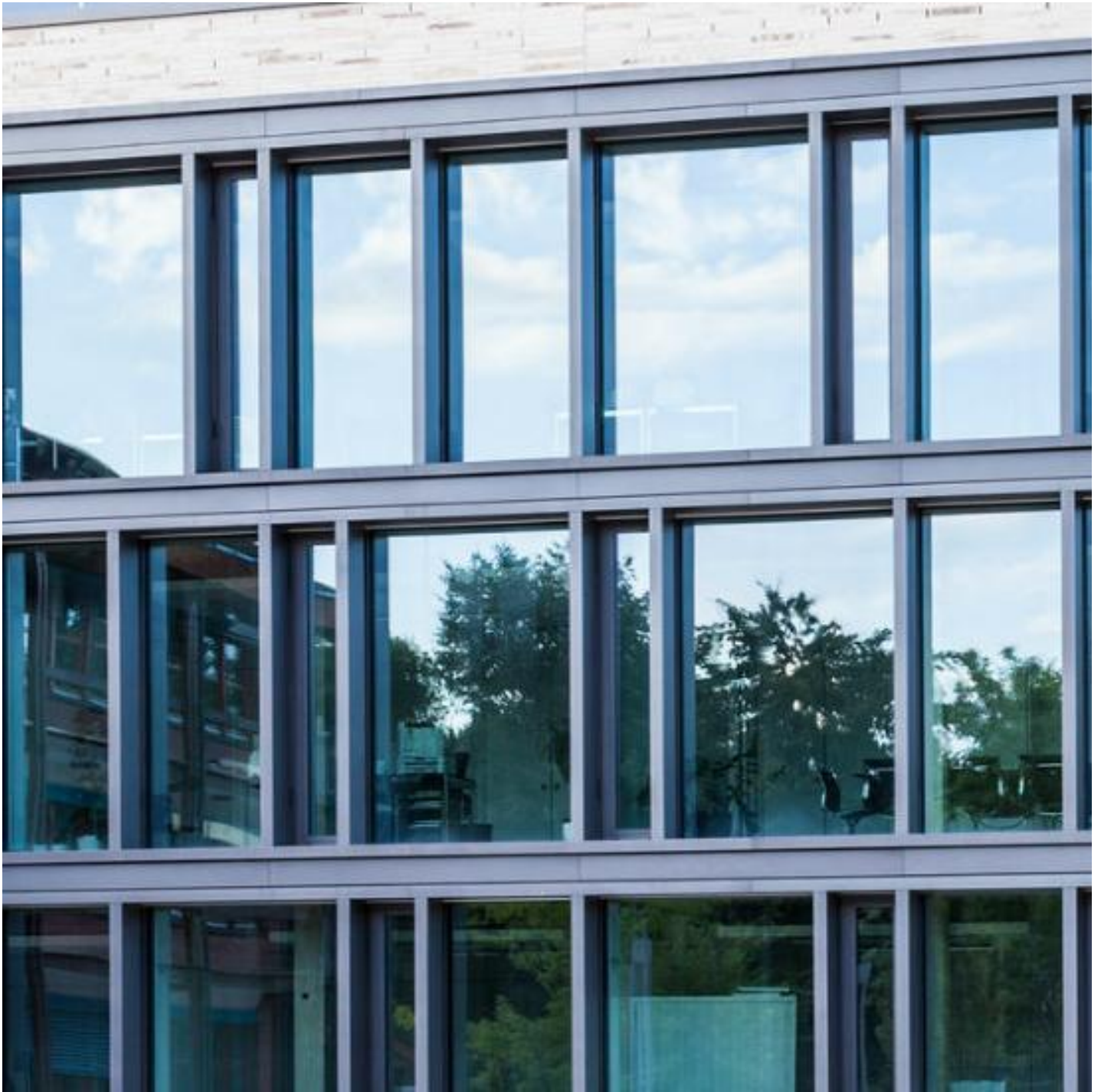
ISOLIERGLAS MIT SONNENSCHUTZ