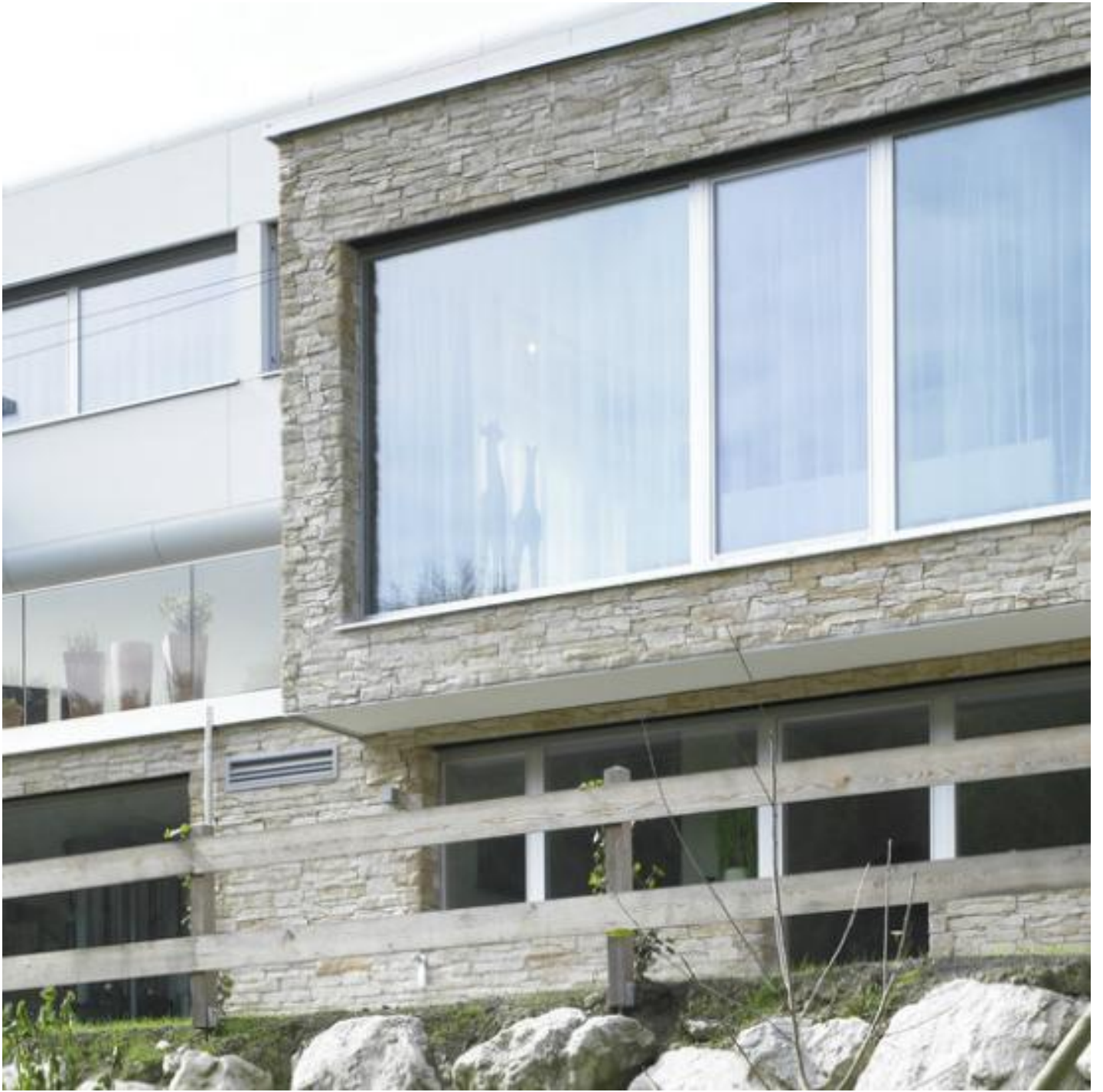
CLIMAPLUS / CLIMATOP XN