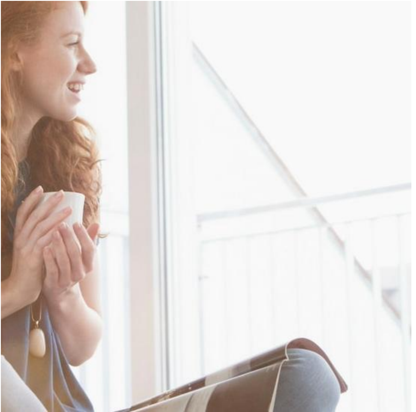
CLIMATOP / CLIMAPLUS XN ACOUSTIC & XN SILENCE