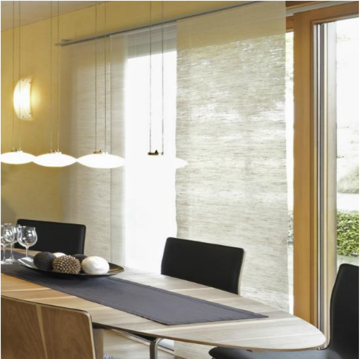
CLIMATOP XN Light