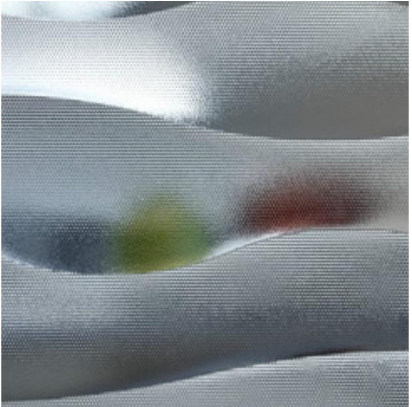
SGG WAVELINE® FLUID